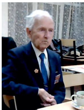
Валентин Максимович Мельников