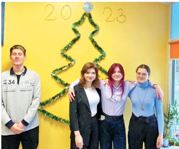
Любимая ёлка 9 Б